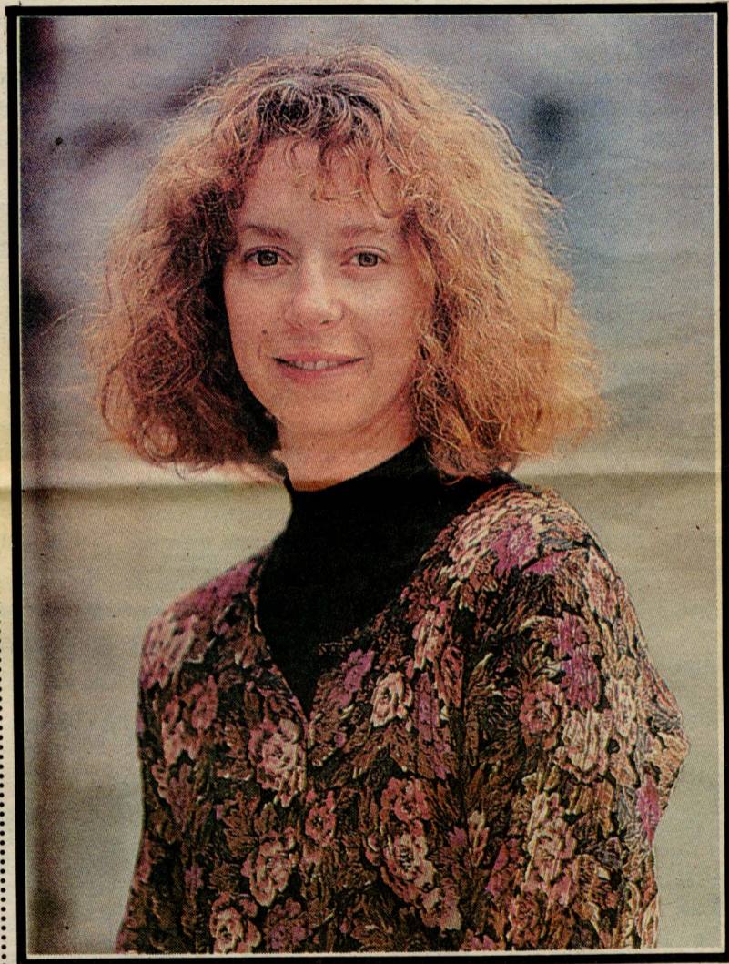
“Me gustan los montajes donde me tengo que sacar la mugre trabajando, donde hay que pasar por estados difíciles, haciendo funcionar la cabeza, tratando de entender”, afirma la actriz.

—Sí, pero quizás mostrar la falta de esperanza, la desolación, sirva para tomar conciencia de que estamos viviendo una situación espiritualmente grave y seria.