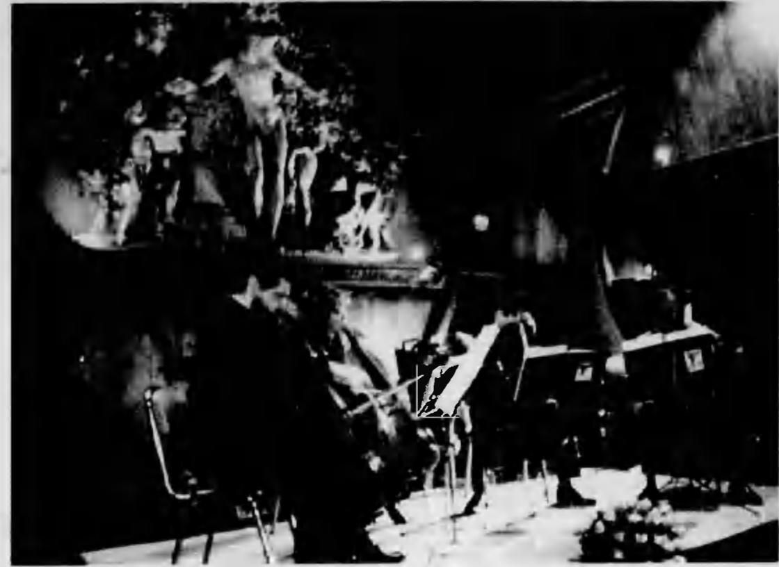
Los Violoncellistas de Buenos Aires en la centenaria bodega Escorhuella, situada en la parte céntrica de la ciudad.