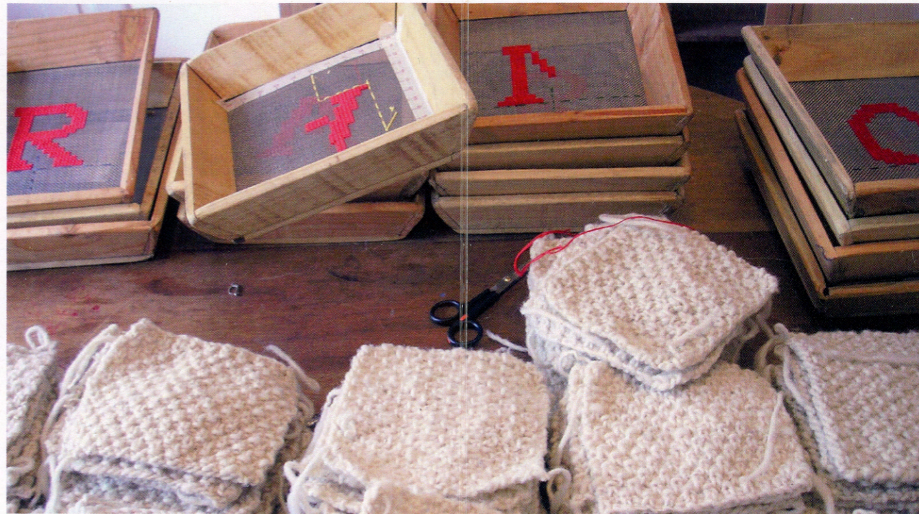
Ficción de un Origen (2006), Dos autorretratos tejidos en lana de oveja cardada e hilada a mano y teñida en escala de grises. Texto bordado a punto cruz en cernidores de malla de acero y madera. Izq. detalle de la instalación. Der. detalle del proceso.

El fragmento de un poema de Paul Celan bordado en punto cruz sobre cernidores de acero y madera conecta dos autorretratos de la artista en la obra Ficción de un Origen , del año 2006, trasladándonos al momento exacto en que Nury adquiere la nacionalidad española. Aquí, es el mismo cuerpo de la artista el que problematiza respecto al desarraigo y al