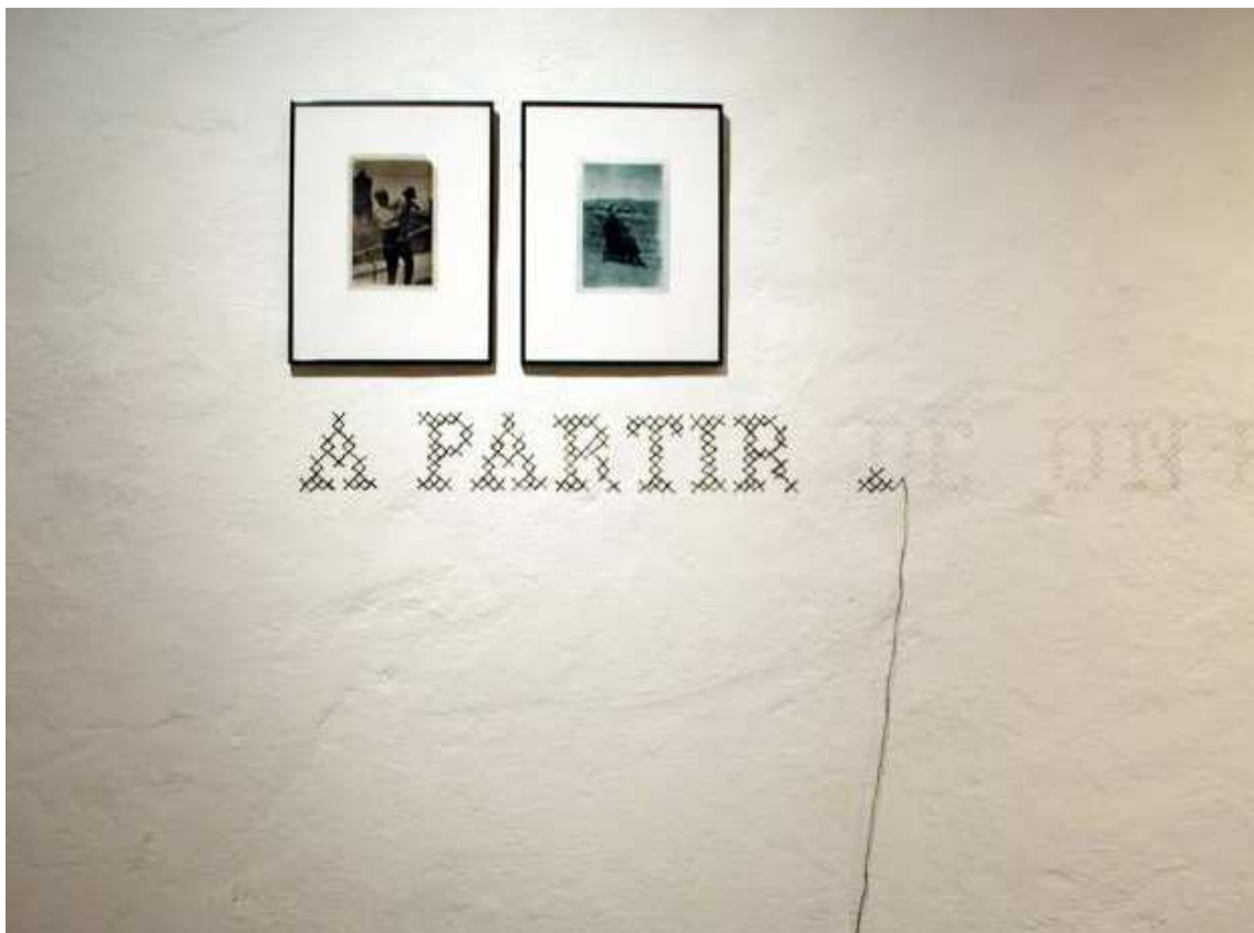
Correspondencias de Mayo