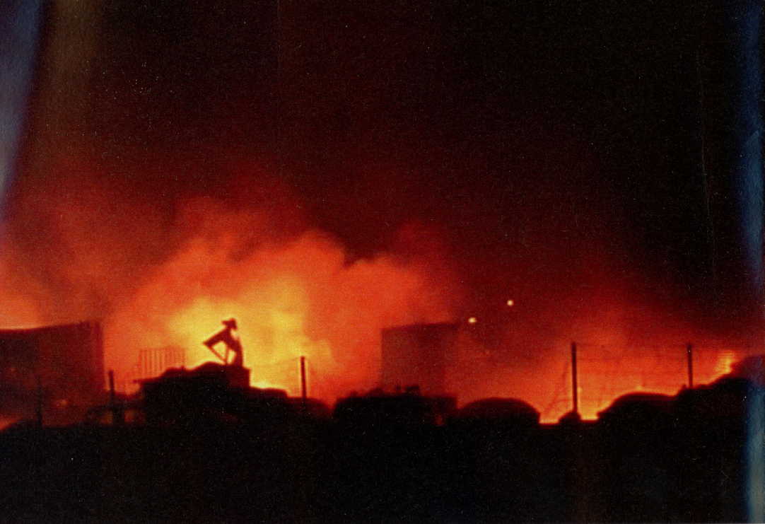
From The Archives of the London Fire Brigade DV (4:3) 10'28" Color Sonido 2009 © Harry Meadows