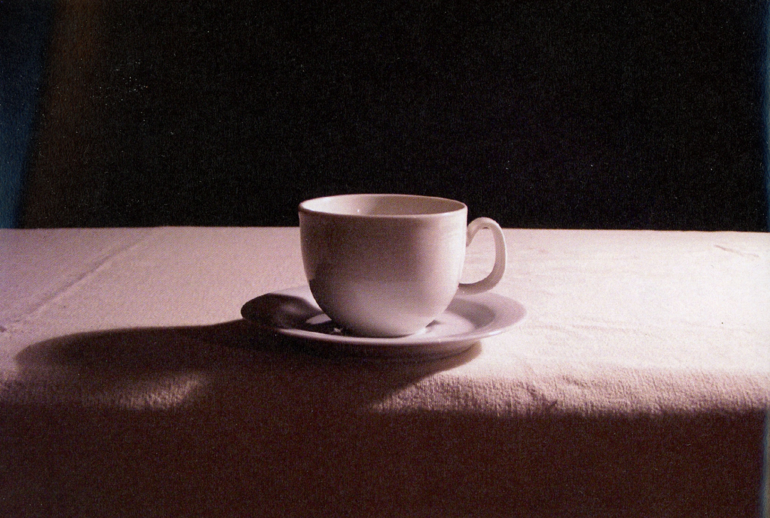
Enferma HDV 3'20" Color Sonido 2010