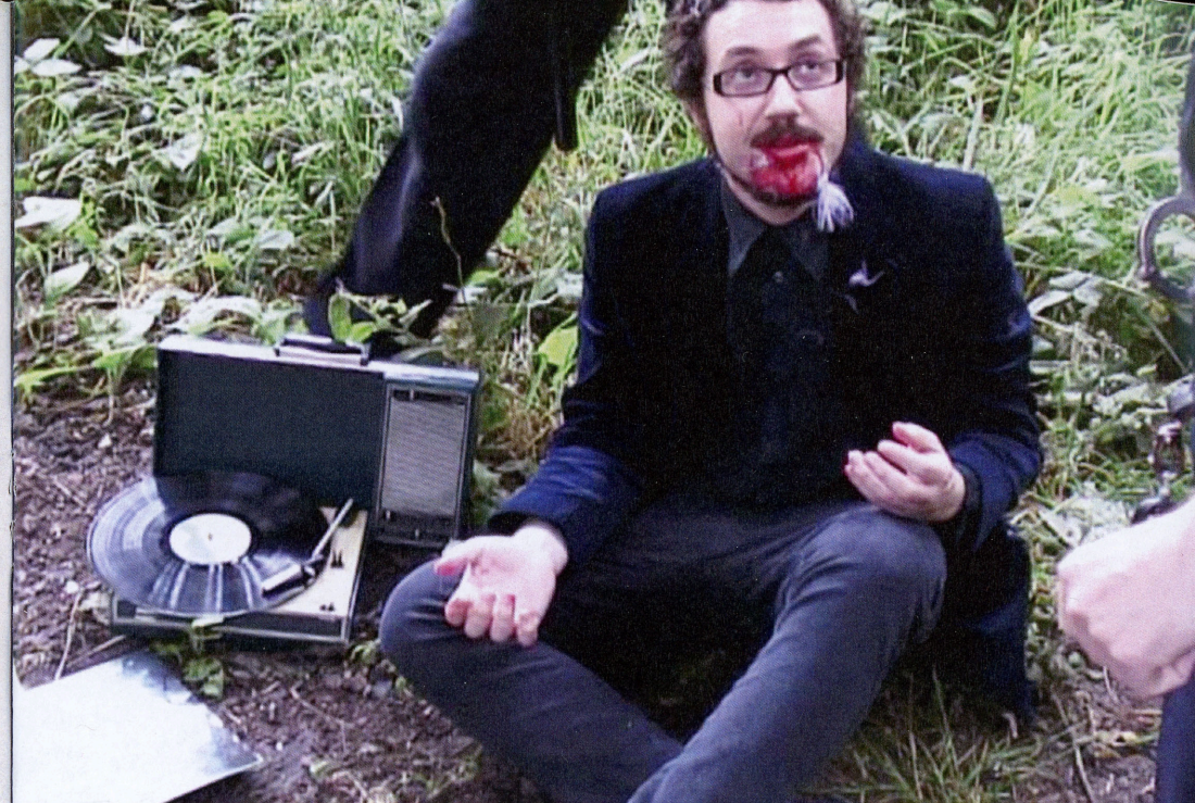
Crywolf (Making Of) MDV (4:3) 9'06" Color Sonido 2007

Licenciatura en Artes Visuales de la Universidad de Chile / Magister en Artes Visuales, Universidad de Chile. Selected exhibitions: "Fondo" Galeria BOA, Mendoza, Argentina, 2003; "Apetito de Destrucción" Galeria Animal; "Tour, In.Co.Nexo" BAC Festival '08, CCCB, Barcelona, España 2008; "Cohortes 02-07" Museo de Arte Contemporáneo; "Estrechez de Corazón" Galeria D21, 2009. Recipient of FONDART, 2005.