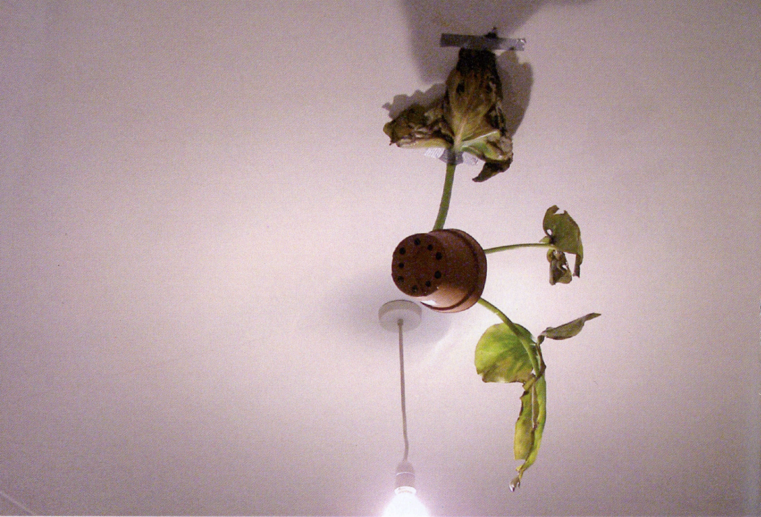
Fortune depends on the tone of your voice Mixed media, Dimensiones variables 2010