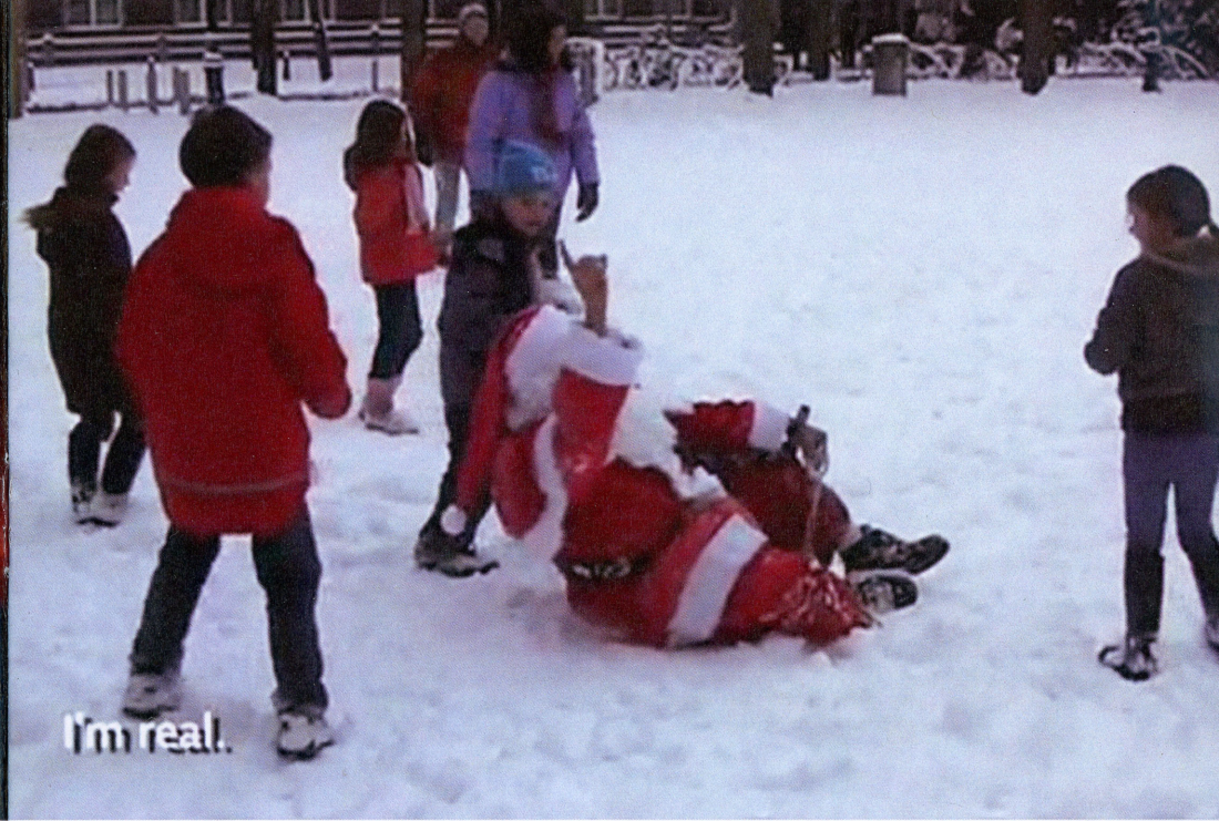
Who is real? (Episode I) HDV 4'46" Color Sonido 2009

BA Fine Art, Wimbledon School of Art / MFA Fine Art, Goldsmiths College, Recipient of the AHRC Scholarship, UK and the Warden's Purchase Prize, Goldsmiths College. Selected exhibitions: "Jargon of Landscape" Wallis Gallery, London; "Los Miércoles Socialistas" Otro Espacio, Valencia. Recent exhibitions include a video commission by the Royal Festival Hall, 2009. Lives and works in London.