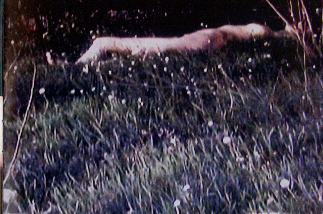
Étant donné: la modification HDV 1'00" Color 2008

Licenciatura en Artes Plásticas, Universidad de Chile 2002 / Magíster en Artes Visuales, Universidad de Chile, 2004. Has exhibited in Matucana 100, Animal, Gabriela Mistral, MAC, ARCO 2006, ARTBO 2007, ARTEBA 2008, "Globalización_Matriz original" Madrid, Lima, Cuzco and Montevideo, "Escenario" and "Invesosímil" in Lima. He was twice the recipient of FONDART. Lives and works in Santiago.