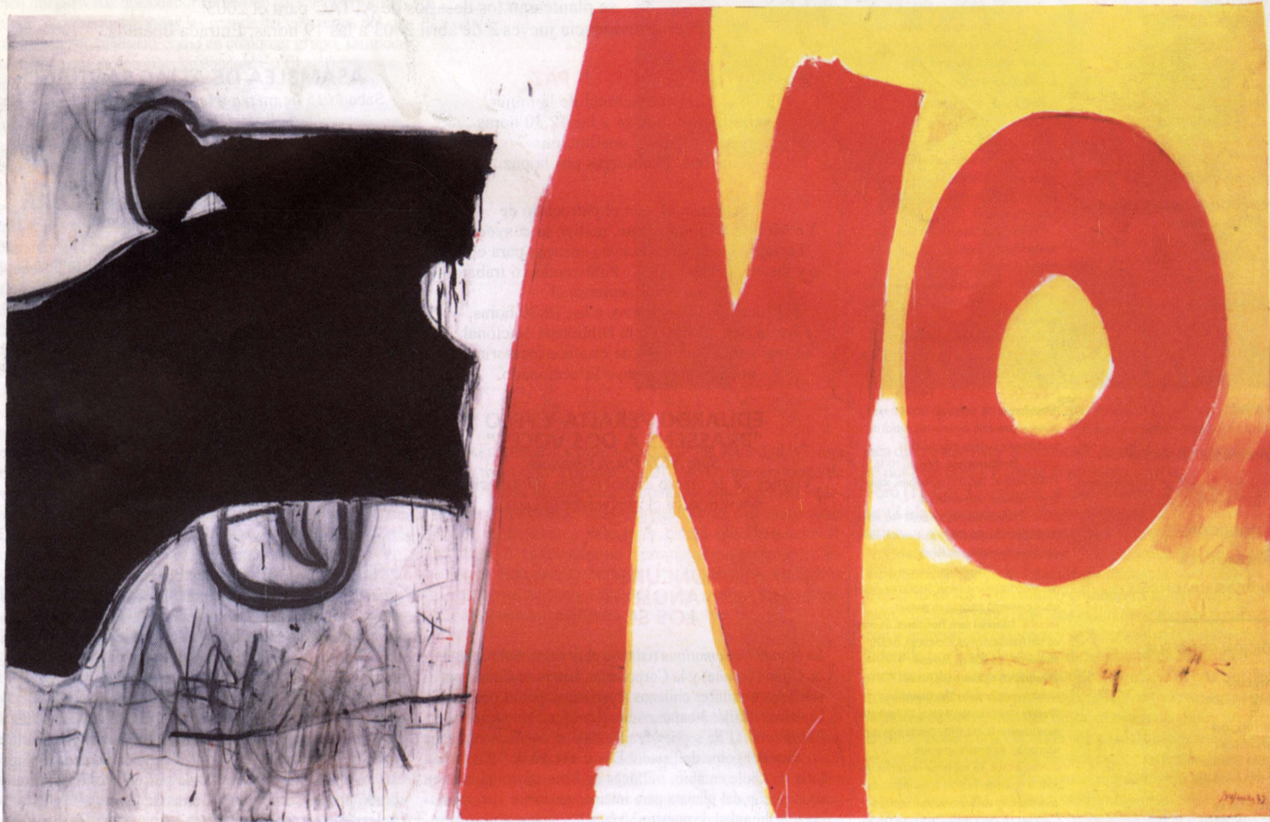
JOSÉ BALMES, "No", 1972